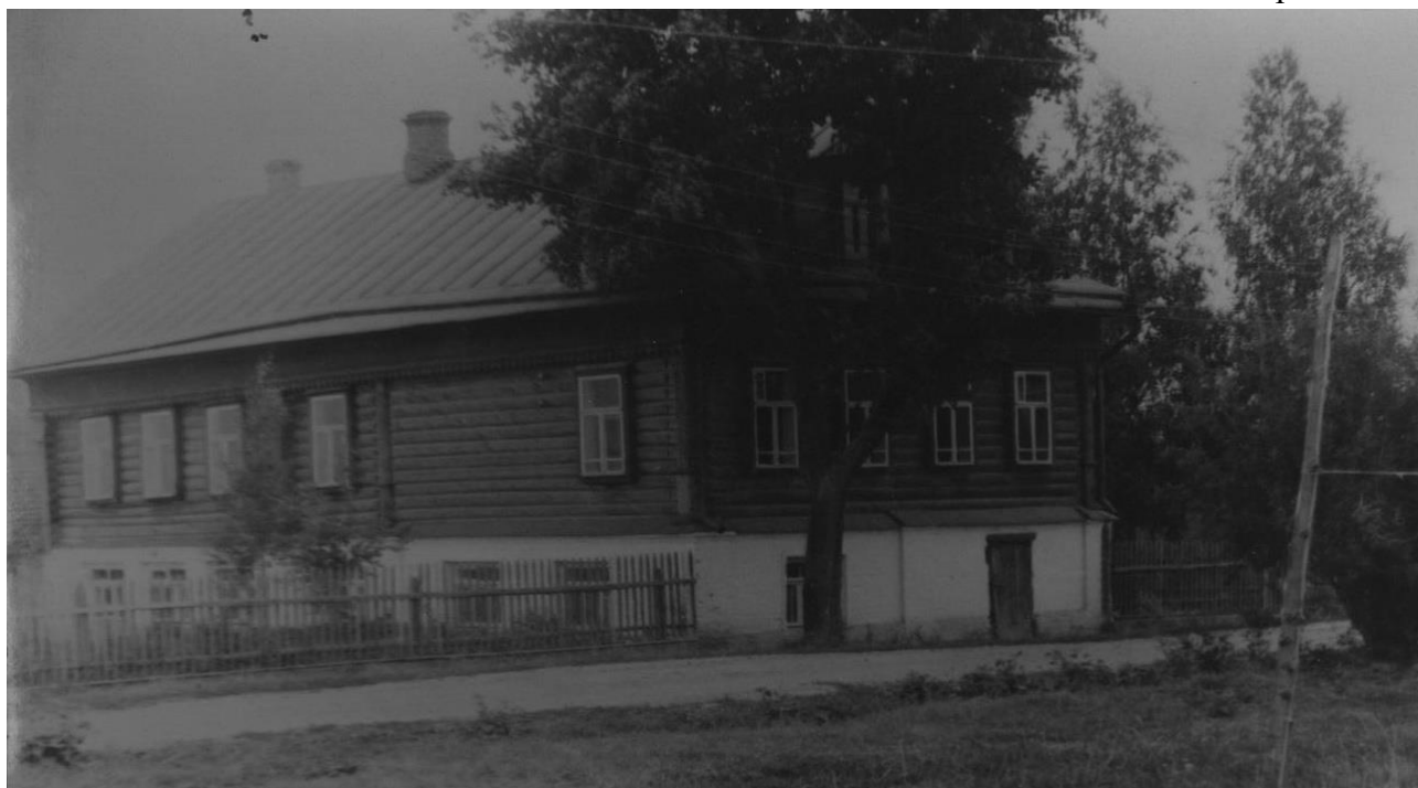
Шурскольская школа, в которой обучался Николай Васильевич