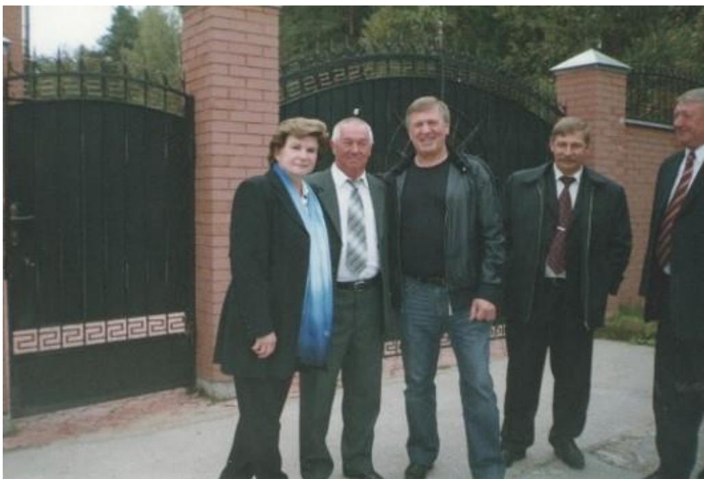
В гостях у Валентины Терешковой (2-й слева)