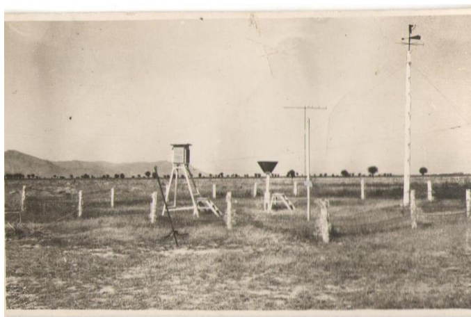
Работа на метеорологической станции в п. Мургаб