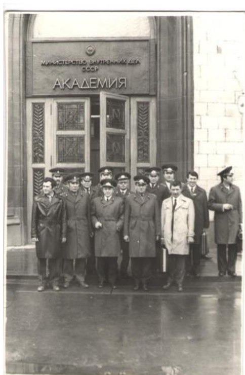
Учёба в академии УМВД СССР (1977 г.)»