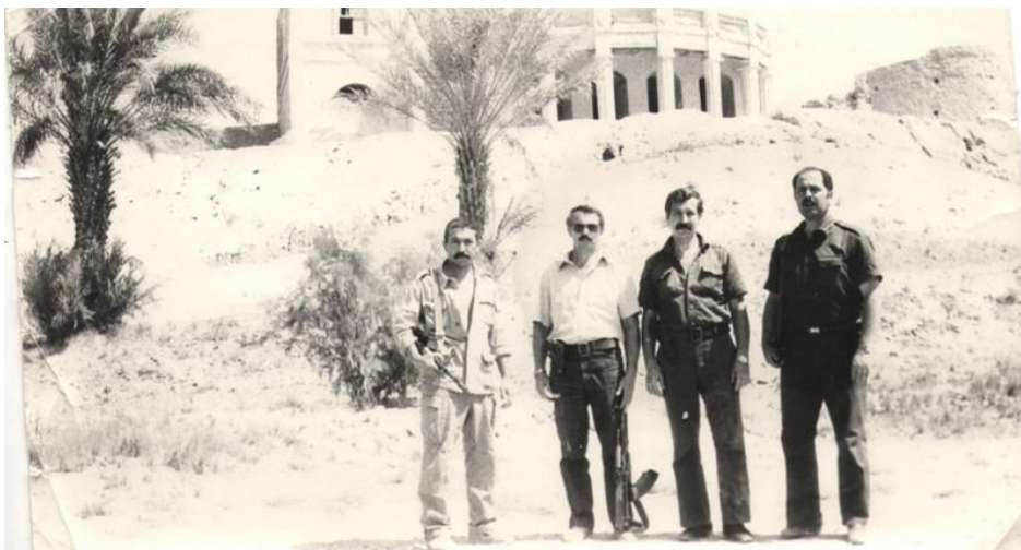
Служба в Афганистане