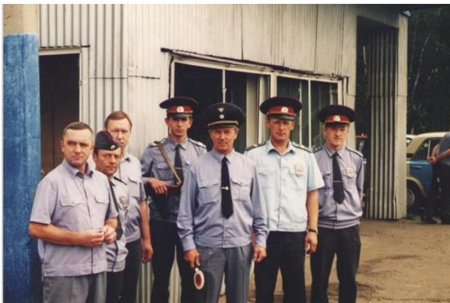
Работа в транспортной инспекции (на фото в центре)