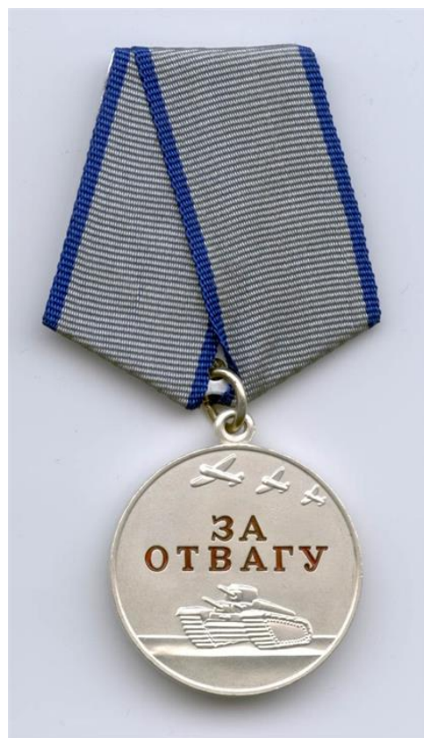
Медаль За Отвагу