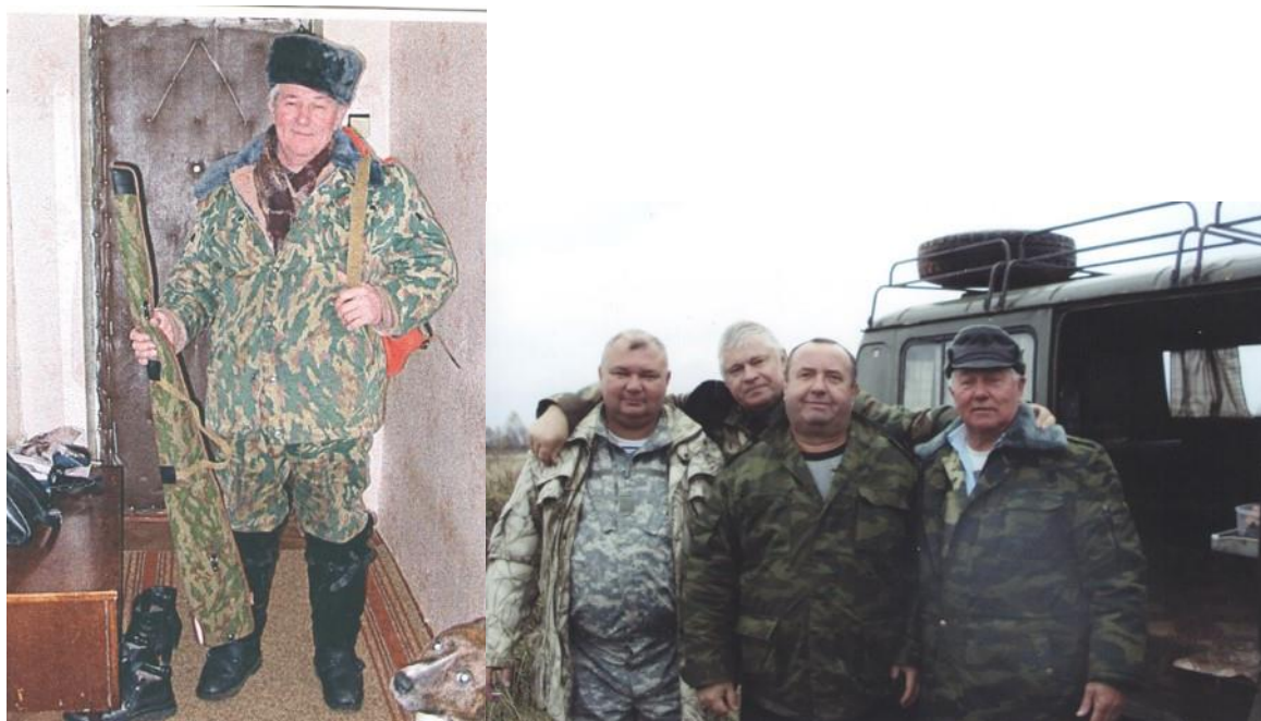
Увлечения на пенсии