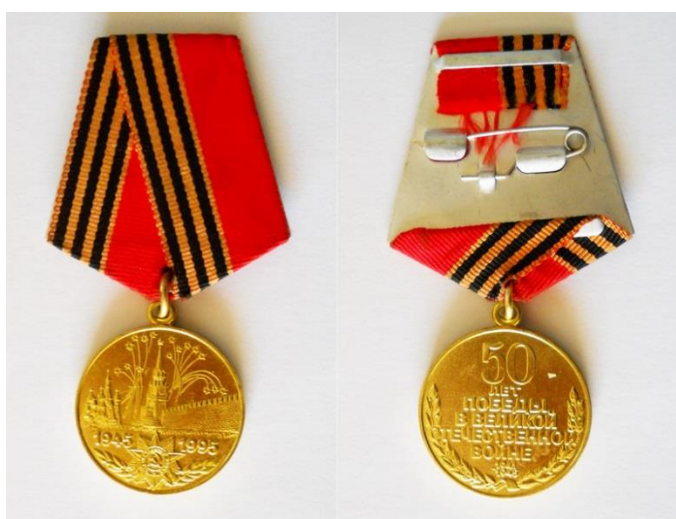
Медаль 50 лет победы в Великой Отечественной войне