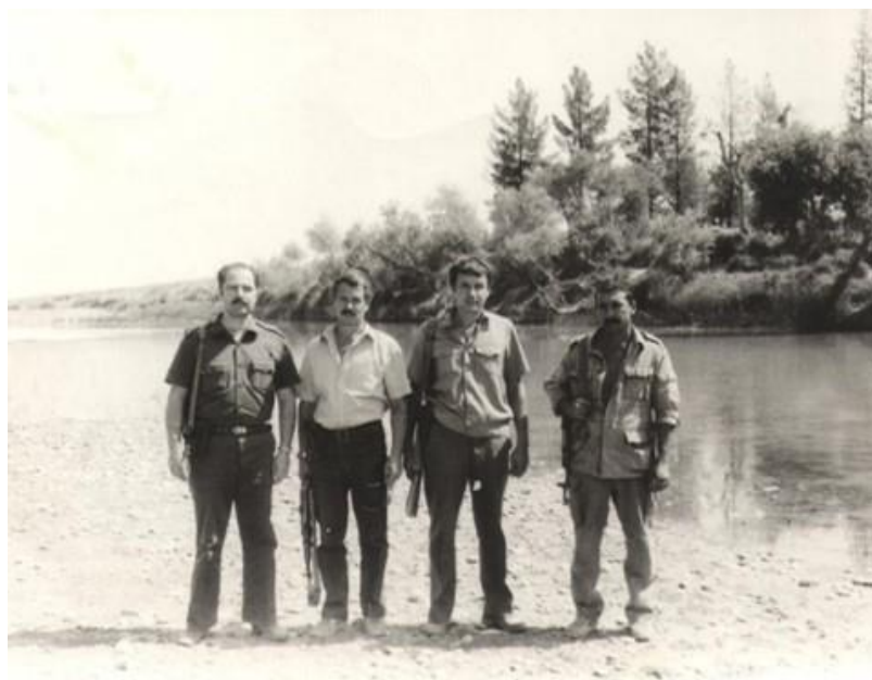
На берегу горной реки Фарахрут (2-й слева)