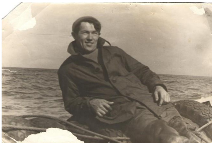
Занятие рыболовством во Владивостоке.