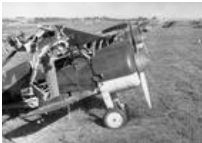
Учеба в аэроклубе, город Ярославль