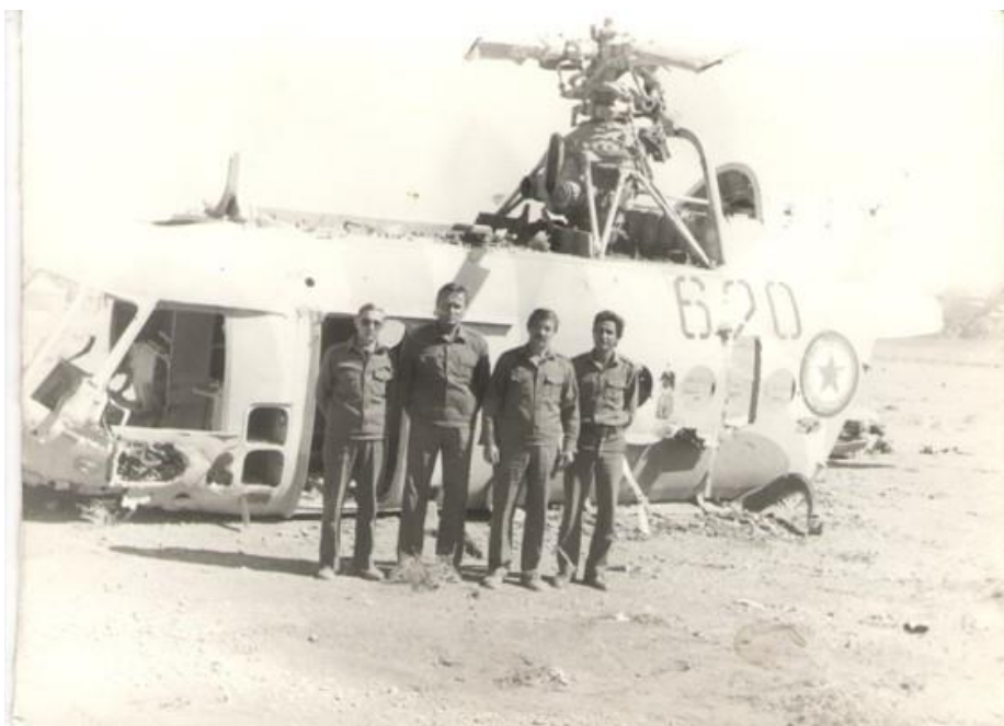
Подбитый вертолёт «МИ -8»