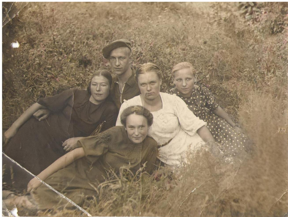
Отдых с друзьями