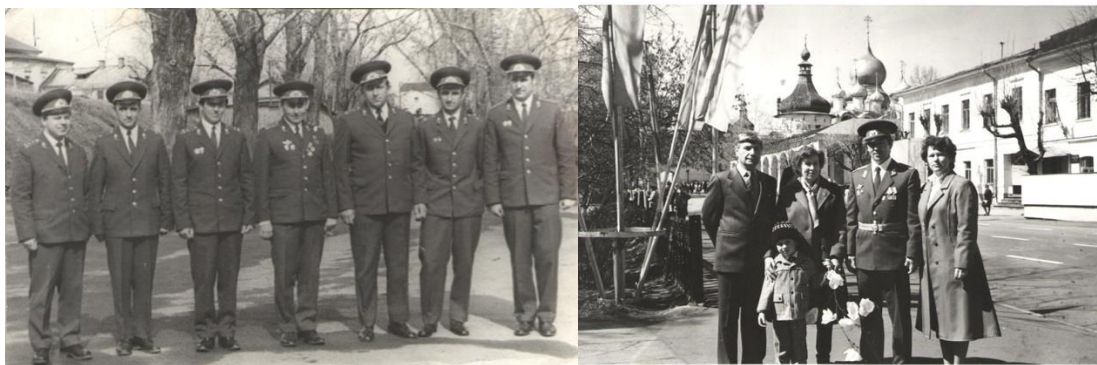
Служба в г.Ростов Великий