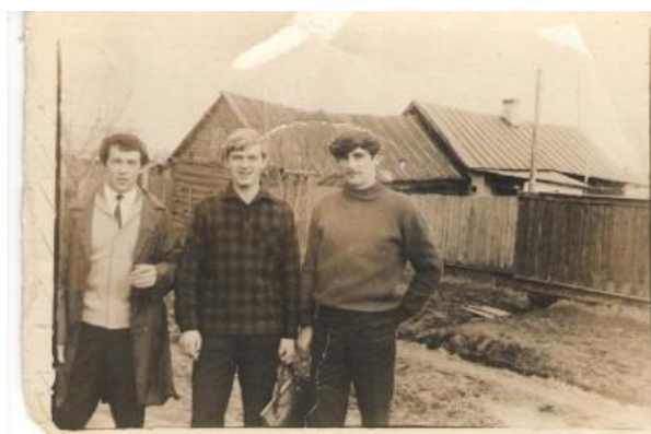
Возращение на свою родину п. Борисоглеб Ярославская область .