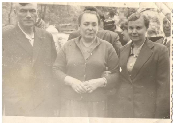
Прабабушка с прадедушкой