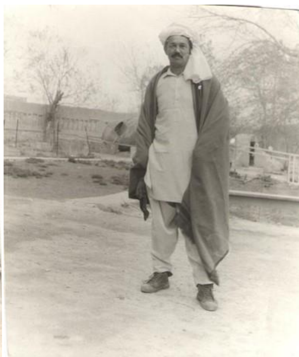
Национальная афганская одежда